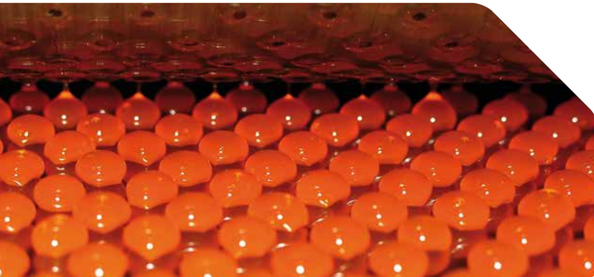
Auftrag von Pastillen auf ein Kühlband mittels Walzendosierung