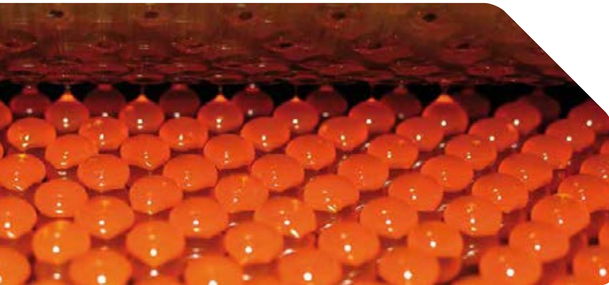
Auftrag von Pastillen auf ein Kühlband mittels Walzendosierung